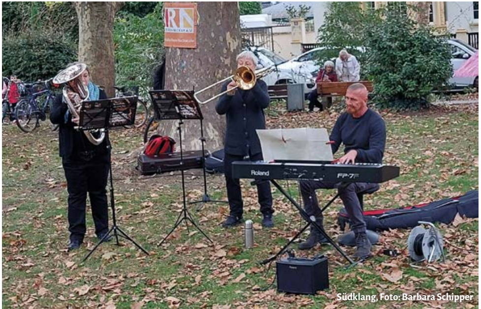
Südklang, Foto: Barbara Schipper