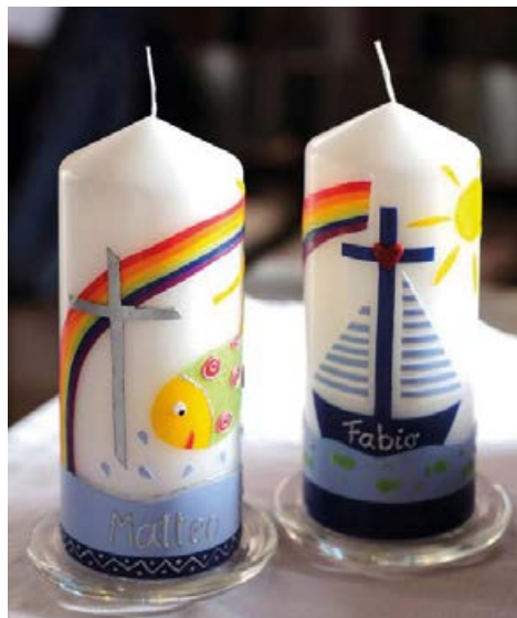
Taufkerzen sagen: Gott begleitet dich mit seinem Licht auf deinem Lebensweg.

Es ist und bleibt besonders an diesem schönen Ort in Ludwigshafen unter freiem Himmel und mit Rheinwasser zu taufen und soll auch fortgeführt werden.