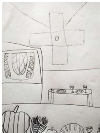
Die Lukaskirche an Erntedank aus Sicht einer neuen Konfirmandin