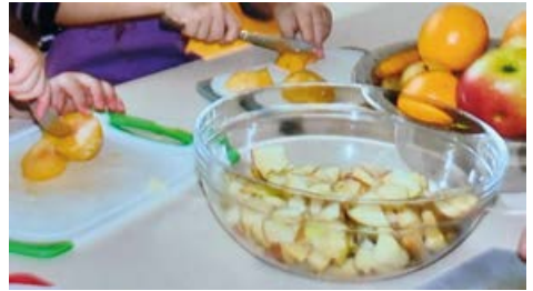
Kinder schnippeln einen Obstsalat

In unseren beiden Kitas haben wir Erntedank-Gottesdienste gefeiert. Gemeinsames Frühstück samt Tischgebet sowie das Lernen von Schnipseln eines Obstsalates gehören auch dazu. „Danke Gott, für alle guten Gaben, die wir teilen und genießen!“