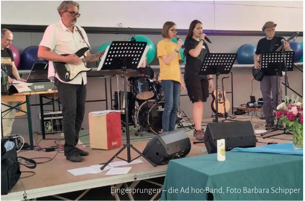
Eingesprungen – die Ad hoc-Band