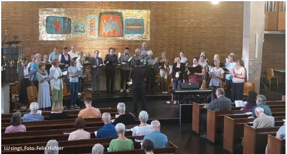
LU singt